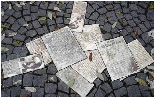
Denkmal für die Weiße Rose vor der LMU München