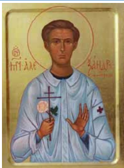
Ikone des Hl. Alexander von München (Schmorell)

После Литургии состоится крестный ход к могиле св. мученика Александра Мюнхенского (Шморель).